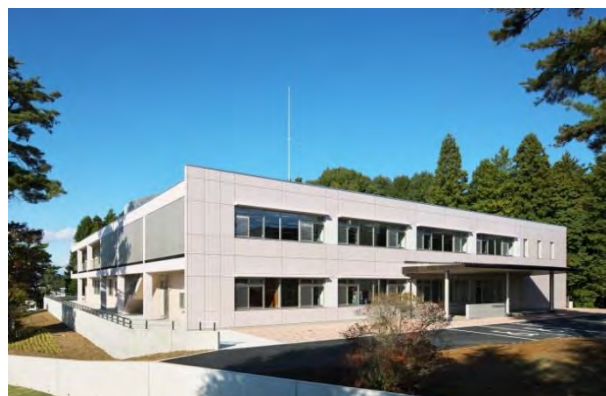
写真 1-1-2 平成23年度に竣工した本場新本館

この間、県の農政関係予算規模の縮小傾向が続く中、研究予算の一般財源も縮小を繰り返し、近年は外部資金の獲得が運営上重要な課題となっている。予算書ベースで平成26年度の一般財源が106百万円であるのに対し、国庫が140百万円、特財が65百万円で、このうちの多くの部分を外部資金が占め、本県内での研究ニーズと外部資金による研究内容の整合性の確保も課題となりつつあった。また、平成23年には、これまでの国からの補助事業(指定試験、委託プロジェクト等)が廃止・縮小され、国は基礎研究および広域品種の育成、地方は実用化といった従来の国主導の枠組みが変わり、国からの補助金や国が担ってきた研究に頼ることが困難な状況になった。地方農業試験場の地域振興に対する責任と役割がますます大きくなり、地域が必要とする試験研究に重点化するなど、効率的な試験研究の推進が改めて必要となった。一方、全庁的な合理化の中で、人事面からは大幅な研究員の削減が求められ、いかに効率的、効果的に研究を進め、かつ研究員の動機付けを高めていくかが問われることとなった。こうした状況を踏まえ、場内での検討を経て、農業試験場の総合力を発揮できる効率的な試験研究体制を目指し、平成24年度に2部1課8研究室体制へと組織再編された。場長の下に2名の次長が配置され、管理部および研究開発部の2部に集約された。研究開発部には横断的に研究の調整を行う2名の研究統括監および企画調整を担当するスタッフが配置された。また研究開発部に水稻研究室、麦類研究室、野菜研究室、果樹研究室、花き研究室、生物工学研究室、病理昆虫研究室、土壌環境研究室が設置された。