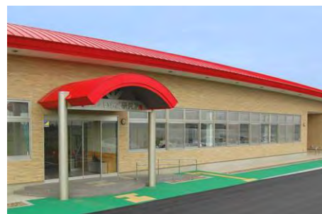
写真 1-1-3 いちご研究所研究棟(2010)

平成20年度からの再編整備に伴い、平成20年10月に、生産・流通に関する調査・分析、研修・情報発信などの機能を有するいちごの総合的な研究開発拠点として、栃木市大塚町の栃木分場内に開所した。平成21年4月に、企画調査担当と開発研究室が設置され、平成22年3月に研究等が竣工した。