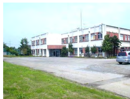
写真 1-1-4 栃木分場本館(2009)

平成12年4月の全場的組織改編に伴い、ビール麦研究室といちご研究室に名称変更された。平成18年3月に、かんぴょう関係の試験が終了した。平成19年4月にビール麦研究室は、ビール麦育種研究室とビール麦品質研究室に分けられ名称変更した。平成20年度からの再編整備に伴い、20年10月のいちご研究所設立により、ビール麦育種研究室とビール麦品質研究室の2研究室体制となった。平成23年3月にビール麦に関する研究が本場に移管され、栃木分場は廃止された。