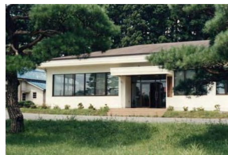
写真 1-1-5 黒磯分場

平成20年度からの再編整備に伴い、平成20年3月に野菜等に関する研究が本場に移管され、黒磯分場は廃止された。同年4月より黒磯農場となった。