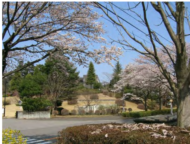
写真 1-1-1 正門付近から見る本場旧本館

計画は5年後の平成17年に見直され、配慮すべき情勢として、食の安全指向、食の多様化、国際化、高齢化、環境への配慮、農業・農村の多面的機能が挙げられ、次期計画として次の研究テーマが設定された。a 新品種の開発、b 生産性向上技術の開発、c 多様なニーズに対応した高品質な農産物生産技術の開発、d 環境に配慮した農業生産技術の開発、e 資源循環型社会の形成に向けた技術の開発、f 農村における水域生態系の維持・保全に向けた技術の開発。