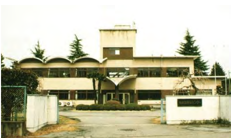
写真 1-1-7 南河内分場

平成6年3月に原種生産部門を高根沢原種農場に移転し、本場直轄の農場となった。平成24年3月にメガソーラー事業候補地となり、同年6月に環境森林部地球温暖化対策課へ所管替えとなった。