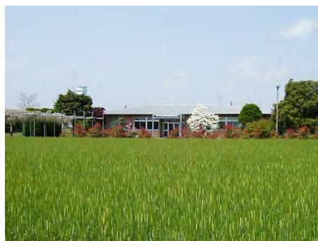
写真 1-1-6 佐野原種農場

平成12年4月の全場的組織改編に伴い育種部から原種生産部門を移管し、原種農場となり、さらに佐野原種農場が統合された。平成20年4月に黒磯農場が統合され、平成23年4月に栃木農場が統合された。佐野農場は平成23年3月に廃止された。