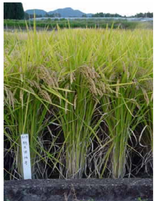
写真 - 2 とちぎ酒14の立毛の様子