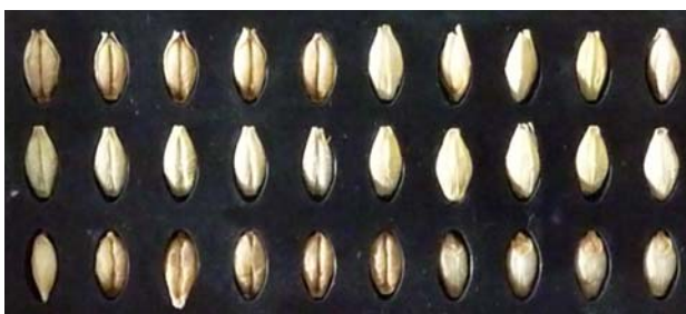
図-2 得られた裸性変異系統の粒の様子

注. U490 は調査の結果、整粒歩合が低いことなどから調査を打ち切った。 U492 は U490 と同一 M2 個体由来の兄弟系統である。